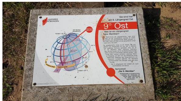
Der 9. östliche Längengrad bei Holzgerlingen