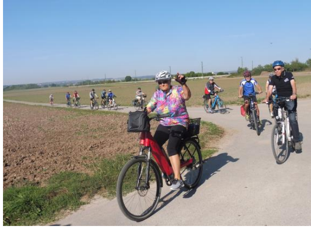
Der Rest der Gruppe an der Jägerlinde