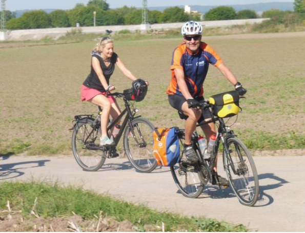
Der TourGuide in der Kurve an der Jägerlinde