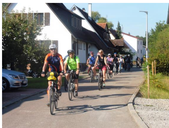
Fahrt durch Gültstein

Weiter ging es vorbei an Mauren wieder durch den schattigen Wald und über die Felder nach Rohrau. Über das Krebsbachtal erreichten wir bald die Feuerwehrezufahrt zur Autobahnraststätte Schönbuch. Kurz darauf unterquerten wir die Autobahn und radelten weiter bei mäßigem Anstieg über den Schlossberg und hinunter in die Herrenberger Altstadt, wo wir am Marktplatz die Tour offiziell beendeten. Ein großes Kompliment ging an alle Radler ohne Strom - sie waren alle gut trainiert ließen sich von den Pedelec Fahrern nicht unterkriegen.