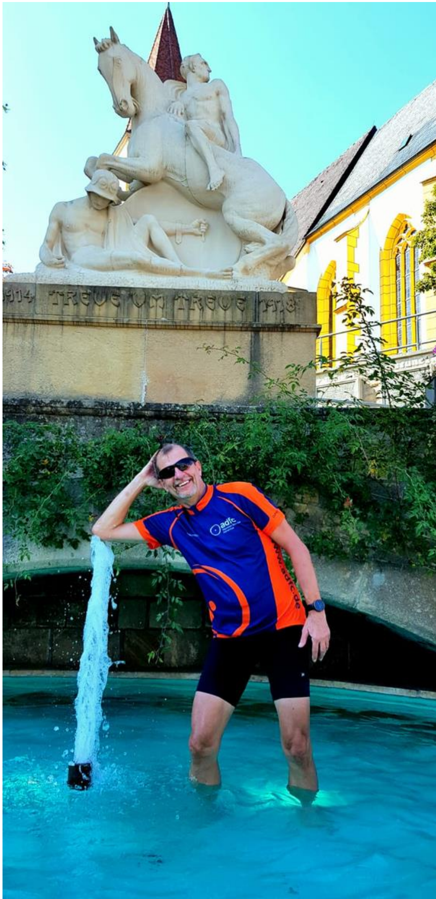
Erfrischung in Holzgerlingen - schön war's