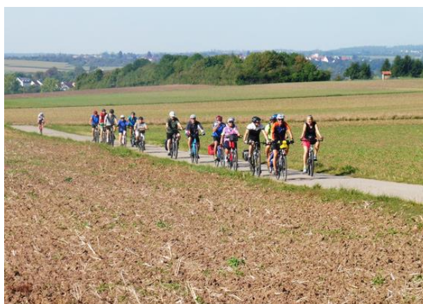
Auf dem Weg zur Jägerlinde hinter Altingen